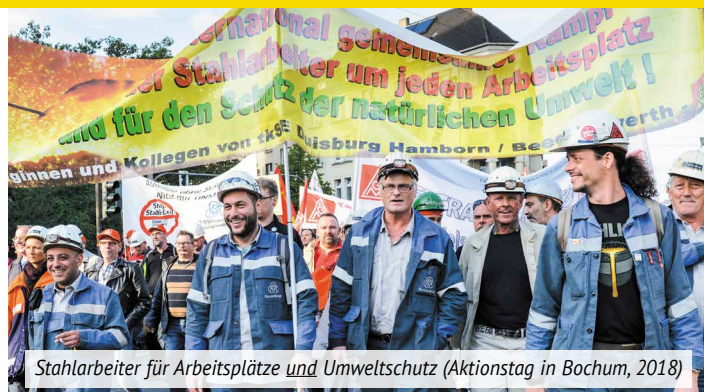
Stahlarbeiter für Arbeitsplätze und Umweltschutz (Aktionstag in Bochum, 2018)