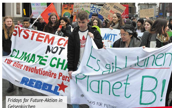
Fridays for Future-Aktion in Gelsenkirchen

Massenhaft rebellieren Jugendliche bei Fridays for Future. Unter Belegschaften wachsen Selbstverständnis und Initiativen, den Kampf um Arbeitsplätze UND Umweltschutz als Einheit zu führen. Die MLPD unterstützt den Aufruf zu einem Protest- und Streiktag am 20. September und mobilisiert breit in Betrieben, Lehrwerkstätten, Schulen und Wohngebieten. Auch die Gewerkschaften ver.di, IG Metall und der DGB haben ihre Unterstützung zugesagt. Eine wirkungsvolle und kampfstärke gesellschaftliche Kraft wird entstehen, wenn sich die internationale Jugend- und Umweltbewegung mit der Arbeiterbewegung verbindet. Sie haben den gleichen Gegner im Kampf gegen Ausbeutung von Mensch und Natur. In den Betrieben der internationalen Übermonopole stehen die Arbeiter den Hauptverursachern der Umweltzerstörung